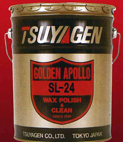
SLシリーズ最高級製品 SL-24樹脂