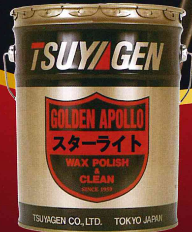
SLシリーズ一番の経済性 スターライト樹脂