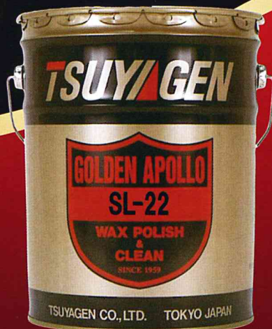
SLシリーズ一番人気製品 SL-22樹脂