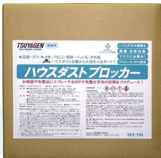
NET.18L (BIB) (小分け用コック付き)

お部屋や布製品にスプレーするだけで綺麗な空気の空間をプロデュース! 予防と除菌に!