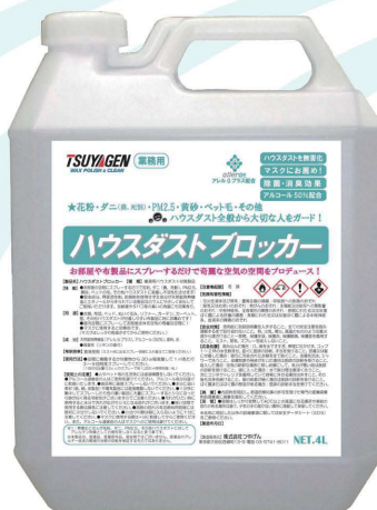
NET.4L x 4 本 (小分け用ノズル付き)