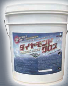
ダイヤモンドグロス 耐汚染性抜群