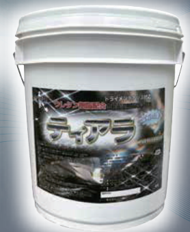
ティアラ ウレタン配合