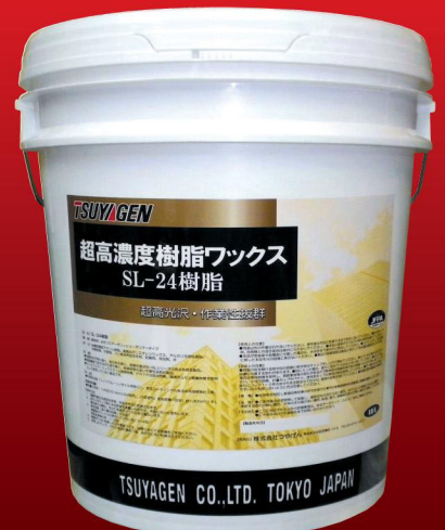
SLシリーズ最高級製品 SL-24樹脂