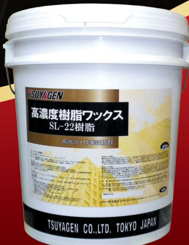
SLシリーズ一番人気製品 SL-22樹脂