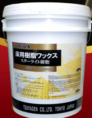
SLシリーズ一番の経済性 スターライト樹脂